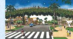
にぎわい交流軸交差部のイメージ