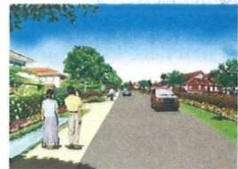
低層住宅地のイメージ