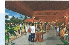
産業振興地区のにぎわいのイメージ