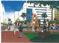
交通広場付近のイメージ