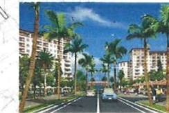
住宅地区内の主要道路沿道のイメージ